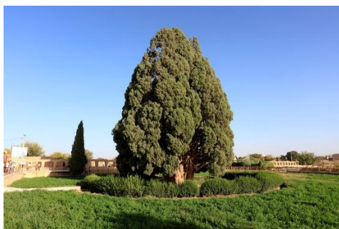
阿巴庫的五千年柏樹