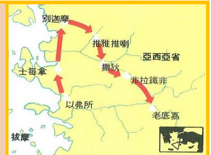
土耳其西部，啓示錄中七教會的順序