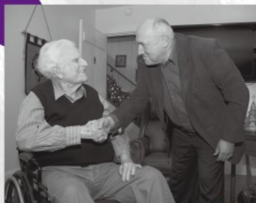
作者漢斯彼得·尼施（右）在葛培理 94 歲生日後不久，到他位於北卡羅萊納州的家中探訪。