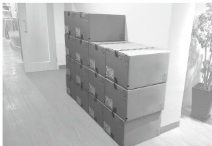
三年前購買的新電腦

記得三年前，微軟公司宣佈不再支援 Window XP 軟件，證主需要在短時間內更新所有同工的電腦硬件，感恩當時有奉獻者支持，避免了因缺乏支援而出現的潛在風險，也大大改善了同工的工作效率。