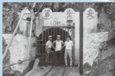
探索、體驗、師友同行，預你一份！